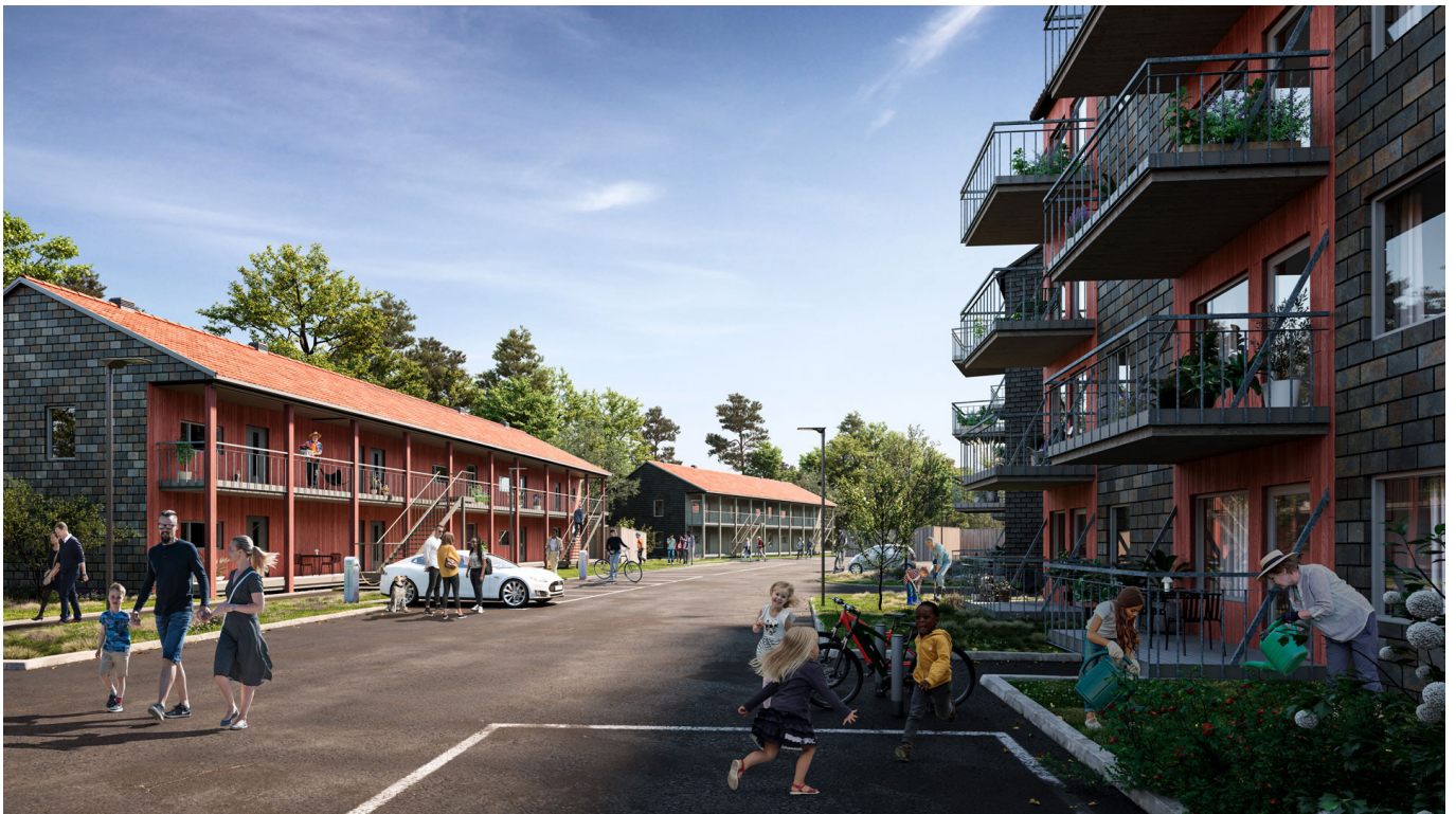
Norra Vitsippan i Salem utanför Stockholm - miljöbild