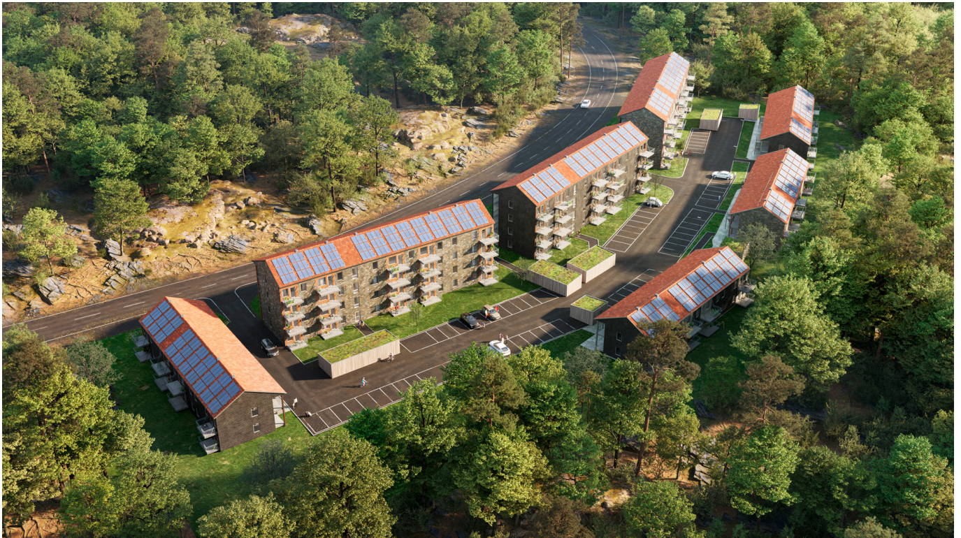
Norra Vitsippan i Salem utanför Stockholm - översiktsbild